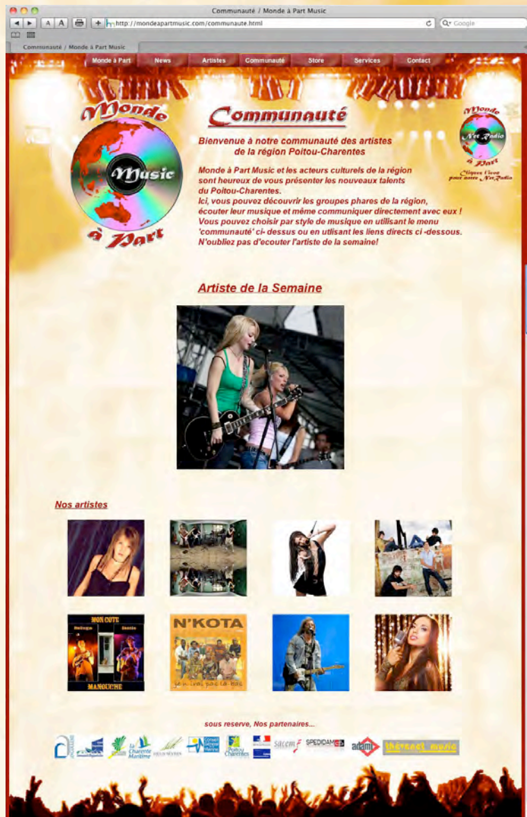
Nos artistes (FIG. A)