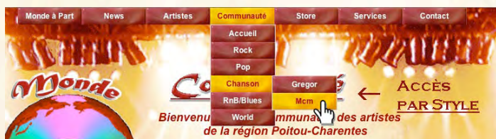
( FIG. B )

Monde à Part NETRADIO, ACCESSIBLE DE LA PAGE D'ACCUEIL, COMPRENDRA UNE 'PLAYLIST' D'AU MOINS UN MORCEAU DE CHAQUE ARTISTE DE LA COMMUNAUTÉ